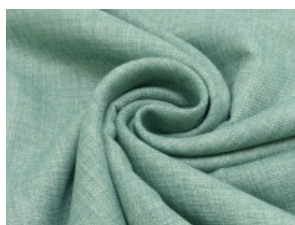
16 mint meliert