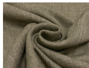
08 braun meliert