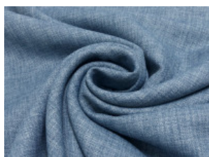
15 jeansblau meliert