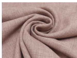
12 altrosa meliert