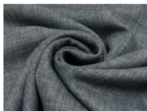
02 anthrazit meliert