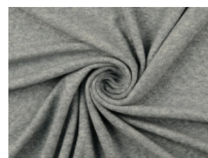
5037 grün meliert