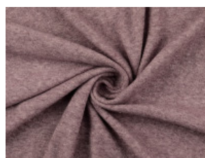
5016 altrosa meliert